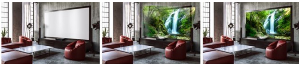
圖 1. 扭曲引擎可透過自動螢幕畫面調整輕鬆設定